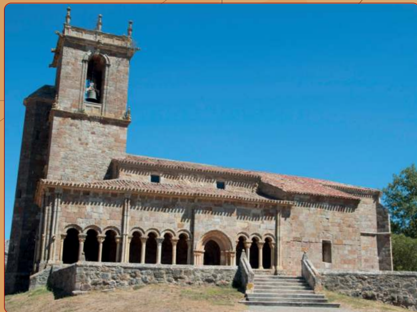
Rebolledo de la Torre: Iglesia parroquial fachada meridional