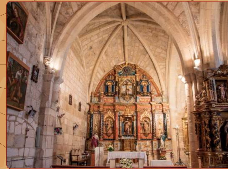
Montorio: Iglesia parroquial; nave norte