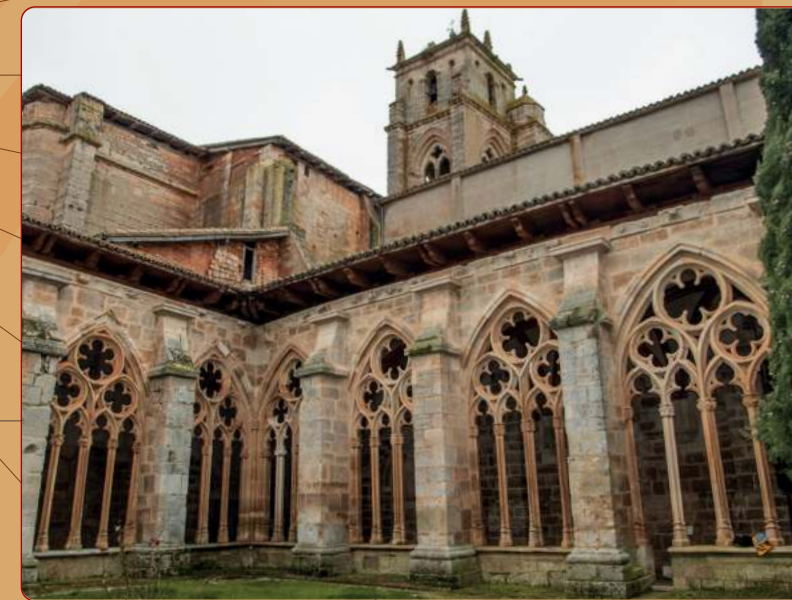
Sasamón: Colegiata; claustro gótico, vista del ángulo sudeste