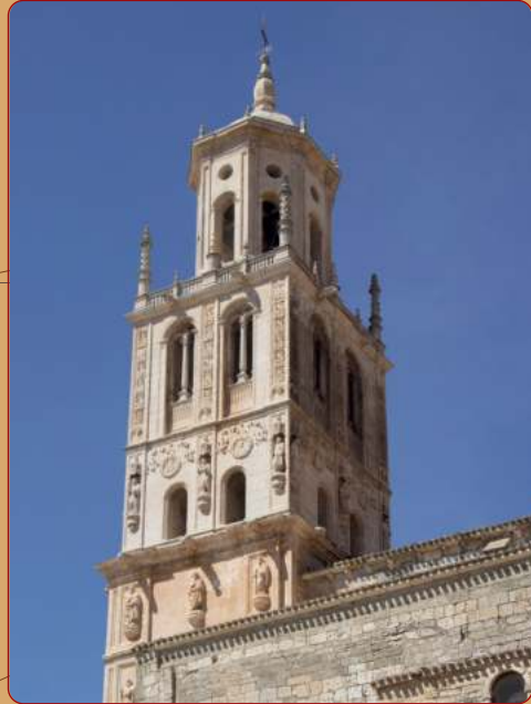
Santa María del Campo: Iglesia parroquial, torre