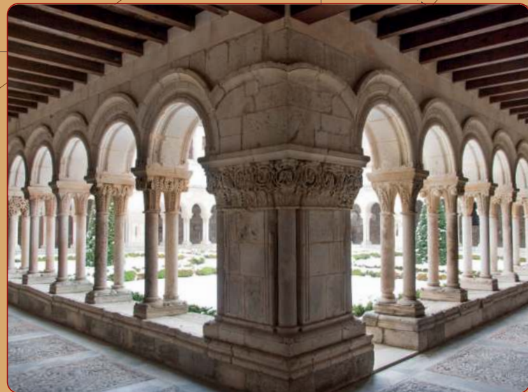
Burgos: Santa María de las Huelgas.