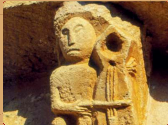
San Martín del Rojo: Iglesia parroquial; ábside, canecillos.