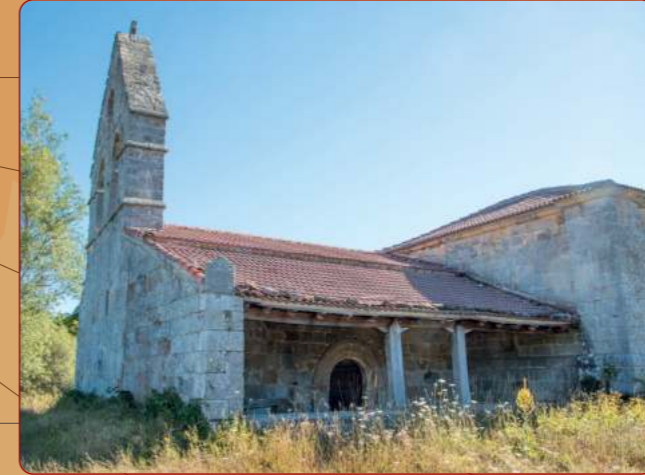
Bezana: Iglesia parroquial; vista desde el sudoeste