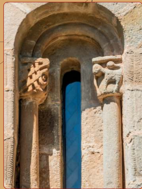
Virtus: Iglesia parroquial; ábside, ventana