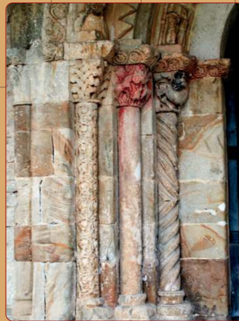
Bercedo: Iglesia parroquial; portada, jamba izquierda