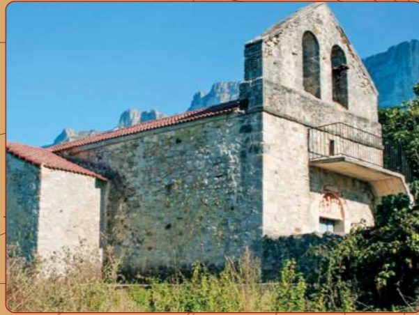
El Vigo: Iglesia parroquial; vista desde el noroeste