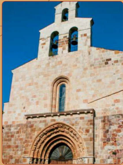
Vallejo de Mena: Iglesia parroquial; fachada occidental