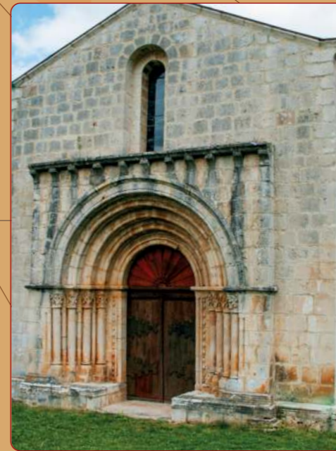
Siones: Iglesia parroquial; fachada occidental