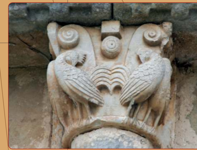
Tabliega: Iglesia parroquial; ábside, capitel de columna entrega