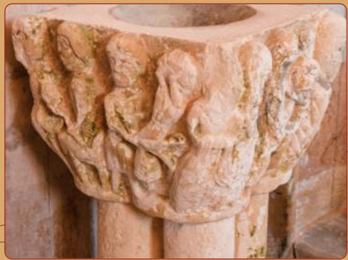
Colina de Losa: Iglesia prioral; capitel de la degollación de San Juan