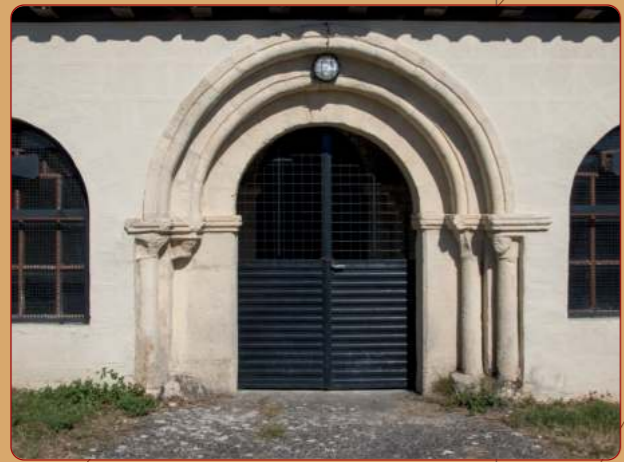
Valleción de Losa: Iglesia parroquial; atrio que precede a la portada occidental