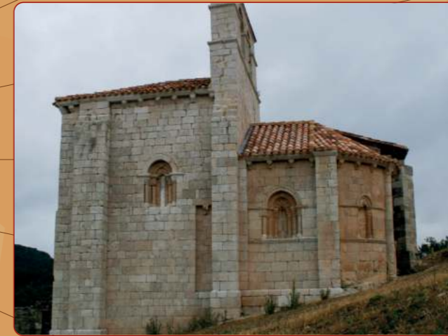
San Pantaleón de Losa: Iglesia prioral; fachada sur